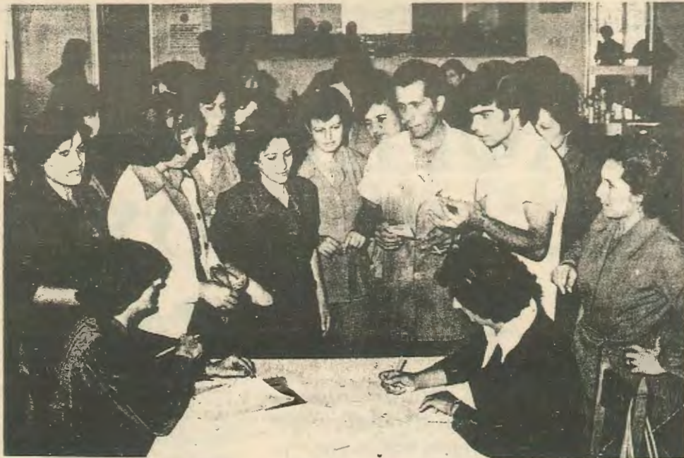
Εργάτες του Λαϊκού καφεκοπτείου συνδράμουν τους συναδέλφους τους απεργούς

Η δική μας θέση είναι ότι είτε το θέλουν είτε όχι οι ηγεσίες των συντεχνιών, οι εργαζόμενοι έχουν κάνει τον αγώνα των βαλιτσοποιών δική τους υπόθεση. Εκείνο που πρέπει να γίνει είναι ότι ολόκληρη η εργατική τάξη να συσπειρωθεί γύρω από κάθε αγώνα εργατικό τώρα και στο μέλλον για να σταματήσει τις εργοδοτικές αυθαιρεσίες και την εκμετάλλευσή.